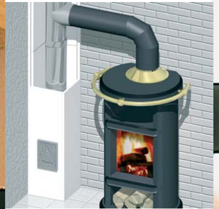
Beispielanwendung mit Kaminofen