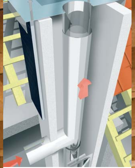
Der Multi EW ist eine wirtschaftliche Lösung für den Neubau oder die nachträgliche Montage