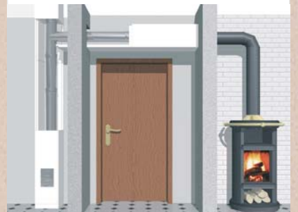
Der LB Multi EW ermöglicht eine flexible Planung